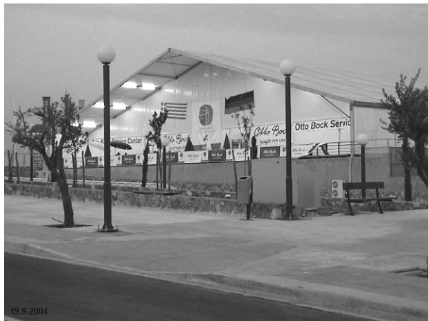
図2 アテネパラリンピックの選手村に設営された修理工場

選手村内の修理工場は 1988 年のソウルパラリンピック以来、義足のパーツメーカーであるオットーボック社（本社：ドイツ）がスポンサーとして、夏冬のパラリンピックで開始したサービスで、同社の技術者と社外のボランティアによって運営されている。2004 年のアテネパラリンピックでは、選手村内に設営されたメインの修理工場のほか、各競技場に 14 箇所のアテナ工場が設置され、1 台の移動工場が競技場と選手村を往復した。