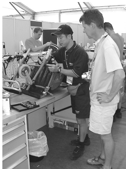
図4 車いすのフレームを修理する様子

アテネパラリンピックの際は、車いすのタイヤ交換を始め、キャスターのアライメント調節、フレームのゆがみ直し、主な修理であった。