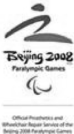
図1 北京パラリンピックのロゴマーク

本年9月6日から17日にかけて北京で開催されたパラリンピックの選手村内に設営された修理サービス工場のスタッフとして働くよていである。修理の状況や選手村内の様々な出来事について報告する。