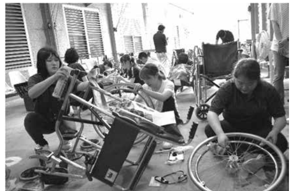
図3. 車椅子修理の様子

【考察】今回の活動では、現地の老人福祉施設において約27台の車椅子の寄贈と合計100台以上の車椅子の点検、修理を行った。中には普段の生活で使用されている、車椅子の調整もあり、机上では学ぶことのできない車椅子適合の技術向上に繋がったと感じた。日本からの参加者に加えて、台湾や韓国の社会人ボランティアの方々も一緒に活動に加わっており、互いに交流を図ることが出来た。また施設を訪問した際は、どの施設からも歓迎を受けた。今回のプロジェクトでは、台湾の老人福祉の現状や制度についても知ることができ、とても貴重で充実した内容であった。