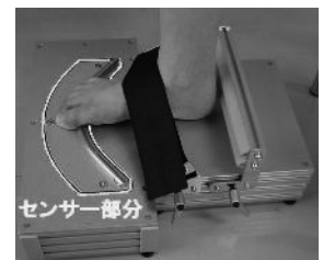
図2 足趾筋力測定器